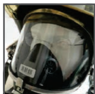
Positie in het ademluchtmasker