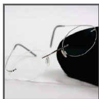
Ademluchtmaskerbril Krulveren / optioneel